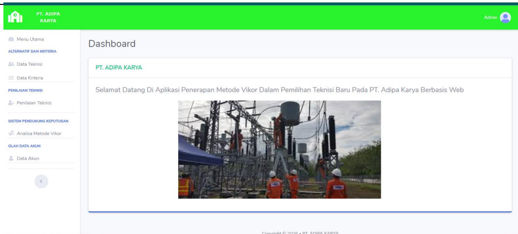
Gambar 3. Tampilan Halaman Menu Utama.